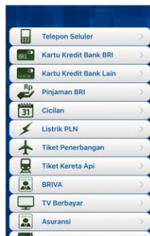
b. Pilih menu BRIVA