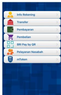
a. Pilih menu PEMBAYARAN